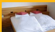
DZ Classic 22 m 2

Camera singola ca. 17 m 2 arredata con mobili Selva.