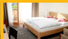
Junior Suite 38 m 2