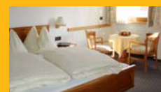
DZ Superior Selva 24 m 2